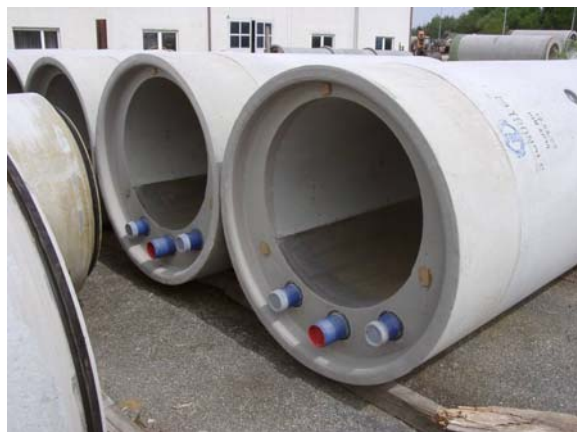
Abb. 2: Wärmetauscher vor Einbau und vorgefertigter Abwasserkanal mit Wärmetauscher