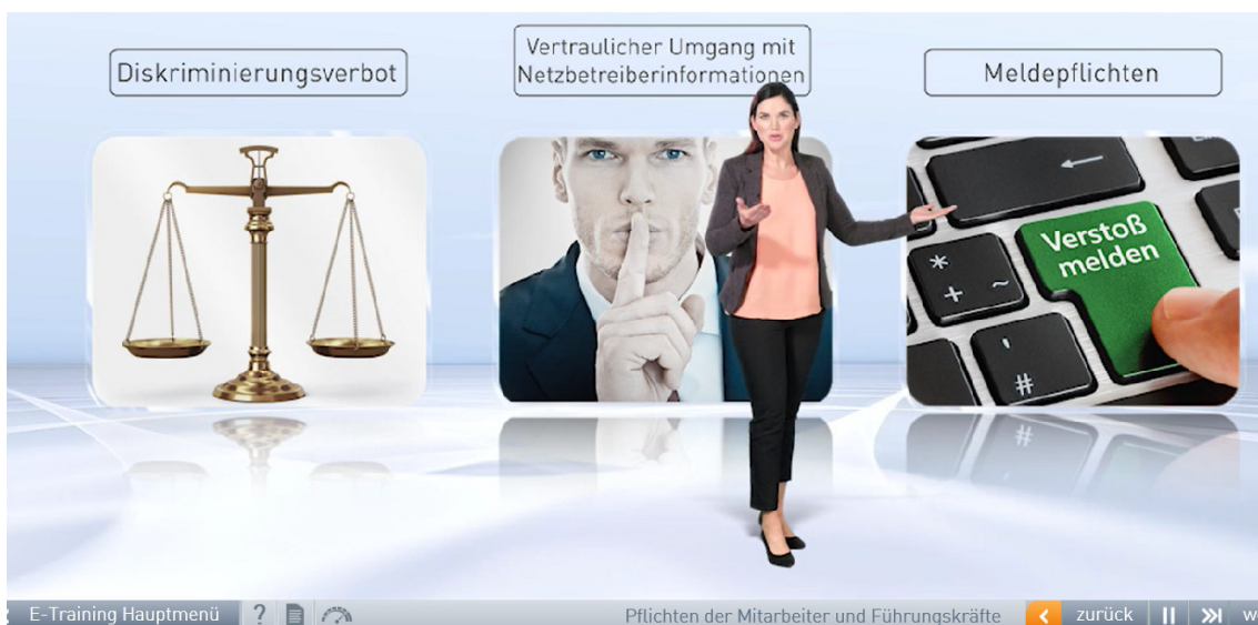
Abbildung 7: E-Learning Schulungseinheit Unbundling

Zur Veranschaulichung wird nachfolgend ein Screenshot der interaktiven Schulung aufgezeigt: